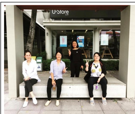
(圖七)與美國實習生的合照

最後我想感謝國合處的老師們與我們系主任和副主任，因為你們在背後給我極大的支持與鼓勵，我才能安心在泰國實習，非常感謝你們，相信這將會是我有生之年中，最難忘的回憶。