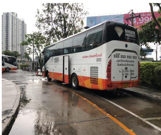
(圖九)兩校區間的接駁專車