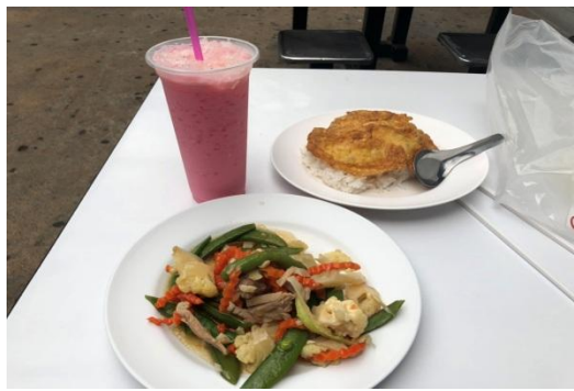
(泰國現正流行的粉紅凍奶)