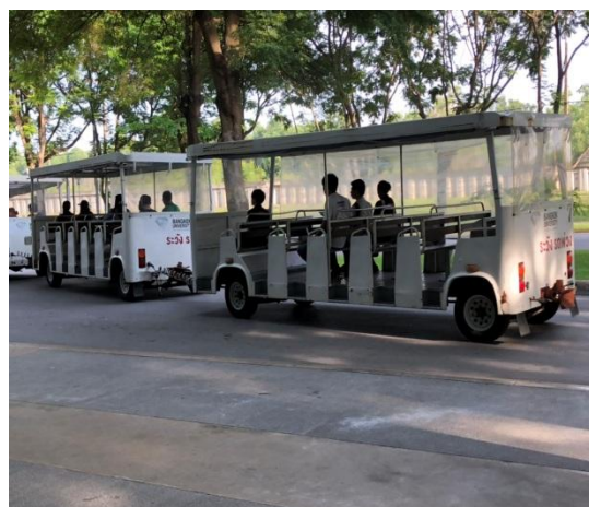
(圖十)朗溪校區校園公車