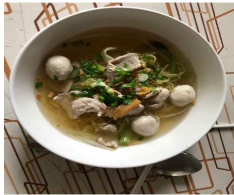
(香甜可口的魚丸麵)