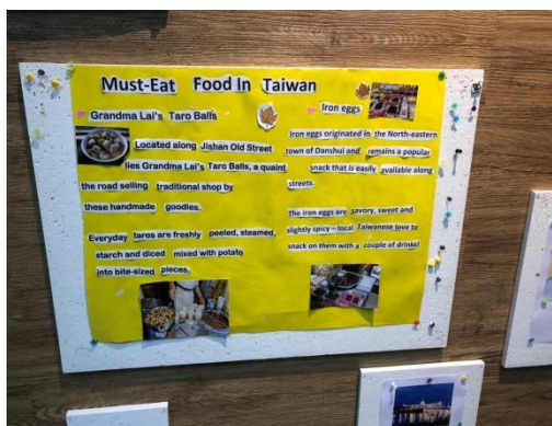
(圖三)替展示牆作布置

International center 是我工作的地方，我的工作說簡單也不簡單，是與學生和老師溝通的橋樑，幫忙學生教室租借和電話溝通，也要進行環境佈置和華語教學。