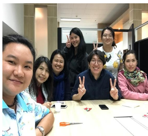
(圖八)與老師們的合照