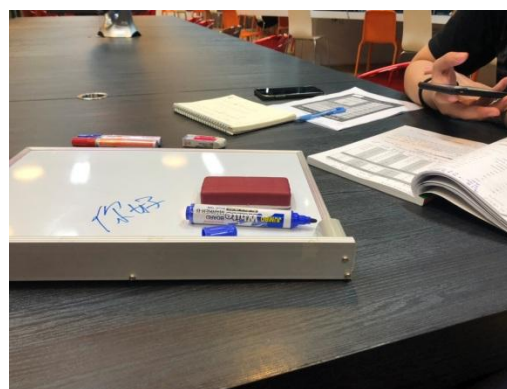
(圖四)進行華語教學