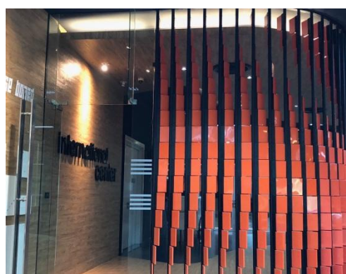
(圖二 International Center)