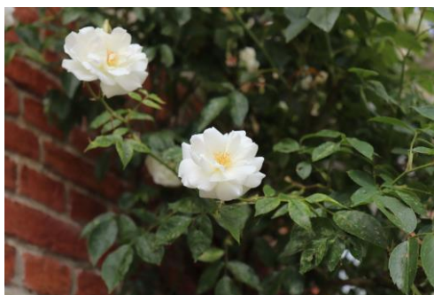
Introductory Guide to Photograph 攝影作品