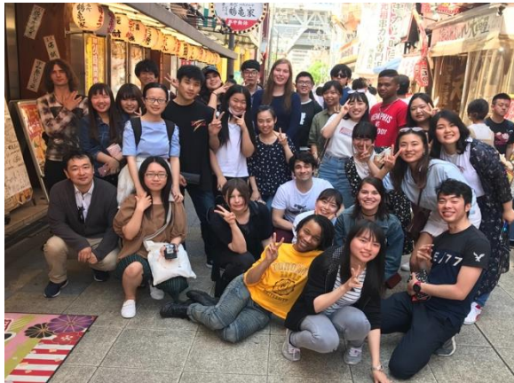
* 校外教學時老師與留學生

半學期的課，不單只是看著課本，還有互動式的課程，我們班上有 7 位同學包含中國人、韓國人、台灣人，幾乎每週都要上台發表、每天都要分組討論、每堂課都要和老師練習會話，即使有同語系國家的同學，我們也都習慣了只能說日文的日子。每學期都有的校外教學，剛好這學期因經費比較多學校帶我們去大阪京都兩天一夜還住溫泉飯店，這一個學期時間並不長但收穫已經超乎我所想像。