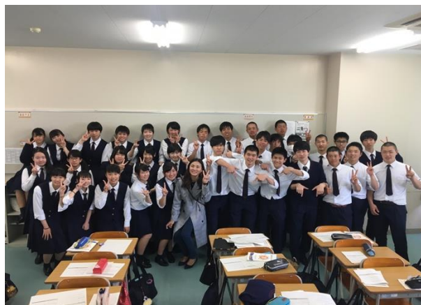
* 熱情的星城高校同學們讓發表很成功

除了玩樂，我和日本室友想要一起打工，而且又想做點特別的，於是我向室友說既然全日本只有名古屋有樂高樂園，那麼一起去樂高打工如何？室友接受了我的建議，上網找相關資訊後，打了電話詢問說明會、面試時間等，就這樣我和日本室友、韓國朋友一起參加了說明會後面試了，接著隔三天後收到樂高傳來的面試合格信。我和韓國朋友選了當時還未正式開幕的樂高樂園主題飯店，日本室友選擇了樂園內。從穿著可愛的制服，打了三個月的工，在不影響玩樂時間、課業時間的情況下排班，遇到了各式各樣的客人，當然母語也發揮了很大的用處，因為從新開幕的第一天就在樂高飯店裡擔任櫃台中文擔當，學了很多、日文也進步的很快，很開心同事們也很都親切，最後一天還幫我們辦了送別會，得到了許多可愛的樂高禮物，如果將來有機會還會再回去找他們的。