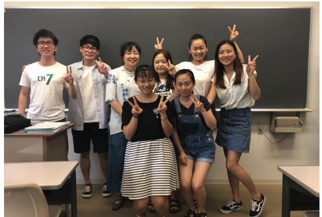
* 課程結束時全班留學生與聽力老師合影