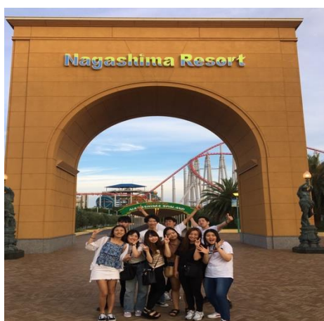
* 和日本韓國朋友去長島樂園

除了上課時間，課外活動時間非常的多，個性外向的我交了许多朋友，每到放假及課外時間通常會與室友或者其他國家的留學生朋友一起出去玩，地理位置位於名古屋的我們，要往上東京、下大阪、左金澤及岐阜等中部關西地區，都很方便，也因為如此在半年內去了許多遊樂園、觀光景點，讓滿滿的中部地區都留下了回憶。