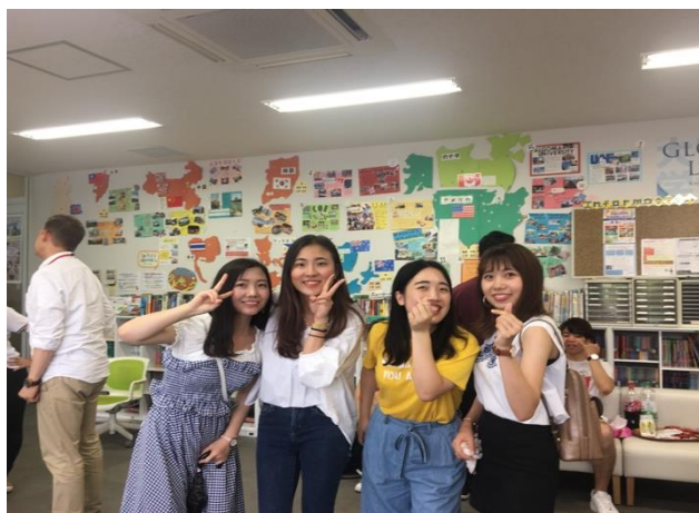
* 韓國留學生及 NGU 的日本學生交流

離校門最近也最顯眼的建築物寫著國際センター（國際中心），專門與各國姐妹校或者與國外交流接洽的部門，裡面的行政人員們都很親切和學生們感情都非常好。隔壁連接著一間和國際中心一樣也是隔著透明玻璃落地窗一間叫做アイラウンジ（iLounge）的大間會話教室，從外面就可以看見裡面有各國的國旗、交流照片，以及每天都有留學生們在與日本人交流的場景，教室是由 NGU 有留學經驗的日本學生們稱為 TA（Teacher Assistant）所管理的空間，相當的國際化也有各種語言的檢定、小說書籍可以借覽，每週學生們也都會在這裡舉辦促進國際交流的活動，讓日本學生、留學生參加，我也在這裡認識了很多朋友。