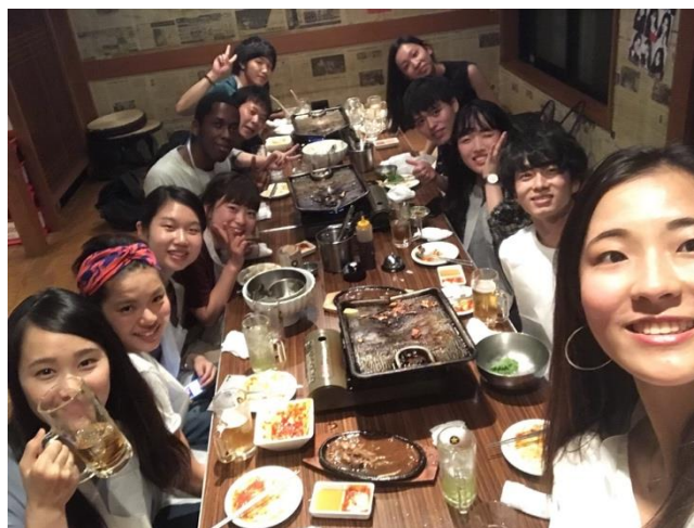
* 慶祝就職活動終於結束的大四生