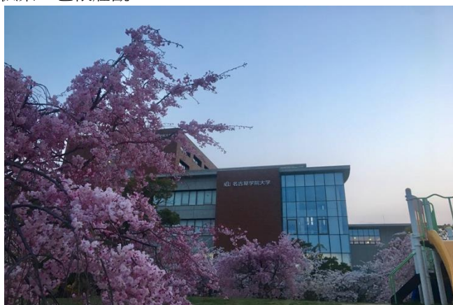
* 校園的櫻花與學校建築物

由於在前往名古屋學院大學（NGU）時，正好大四上學期修了一門台灣觀光日語導覽課程時，認識了一位 NGU 到文藻留學的學生剛好同組一起報告也變成了朋友，所以 3 月 27 日飛機抵達名古屋時她來中部國際機場接我並一起搭電車去學校。名古屋學院大學，是一間與文藻非常相似的天主教學校，校園不大甚至比文藻來的小，但建築物都非常的漂亮有特色，資源也出乎意料的多。因為到名古屋時剛好是 3 月，很幸運地第一次推著行李走進校園時就看見學校旁公園的櫻花已經滿開，聽說秋天時會滿滿的都是楓葉，也很壯觀。