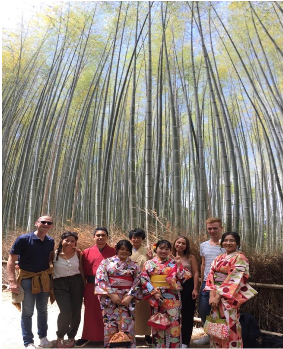
* 和留學生們到京都旅遊