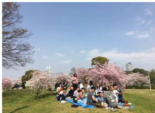
* 日本人與留學生們お花見（賞花）