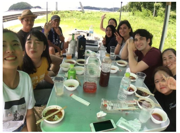
* 空手道老師帶大家去海邊烤肉