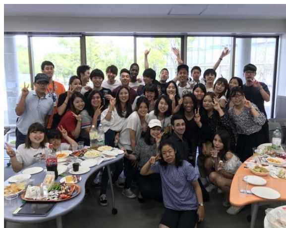
* iLounge 舉辦交流活動

學校雖然不大，但有兩個校區，一個在日比野車站旁，一個則是白鳥校區（離日比野車站走路只需要十分鐘），交換生只會在白鳥校區上課，對我來說很方便因為宿舍就在白鳥校區。學生宿舍只供給留學生及一層一位的日本學生 RA（Room Assistant）住，簡單來說 RA 就是能夠與留學生交流，但當留學生有問題時要第一時間協助的樓長。我認為因為這個制度讓留學生跟日本學生的感情增溫的速度變得更快。房間分為セミナーハウス及 Annex 兩種，前者為兩人一間套房共用廚房浴室廁所且一人一間房間離學校 1 分鐘，後者為四人一間的公寓式 Share House 離學校 3 分鐘，我的房間是兩人一間的セミナーハウス，幸運地我的室友是很可愛的日本人 RA。