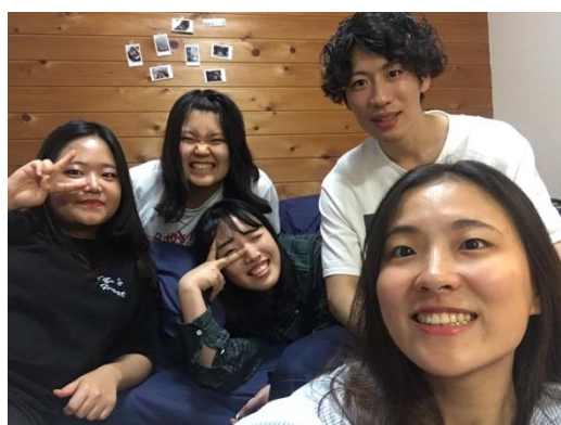
* 與日本室友(最後方)的日常

學校雖然不大，但有兩個校區，一個在日比野車站旁，一個則是白鳥校區（離日比野車站走路只需要十分鐘），交換生只會在白鳥校區上課，對我來說很方便因為宿舍就在白鳥校區。學生宿舍只供給留學生及一層一位的日本學生 RA（Room Assistant）住，簡單來說 RA 就是能夠與留學生交流，但當留學生有問題時要第一時間協助的樓長。我認為因為這個制度讓留學生跟日本學生的感情增溫的速度變得更快。房間分為セミナーハウス及 Annex 兩種，前者為兩人一間套房共用廚房浴室廁所且一人一間房間離學校 1 分鐘，後者為四人一間的公寓式 Share House 離學校 3 分鐘，我的房間是兩人一間的セミナーハウス，幸運地我的室友是很可愛的日本人 RA。