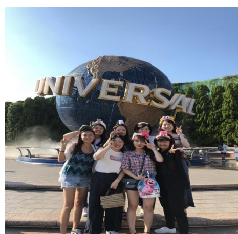
* 和宿舍的朋友去環球影城

另外，某天在網路上看見了召集在名古屋的台灣留學生的一日打工，要到名古屋的星城高中去向要前往台灣修學旅行的高中生們介紹台灣的魅力，我報名參加後也被選上了，準備了一整週的簡報、思考要如何向高中生傳達台灣食衣住行及文化特色，當天很順利地一對一個班五十位同學兩小時的互動式發