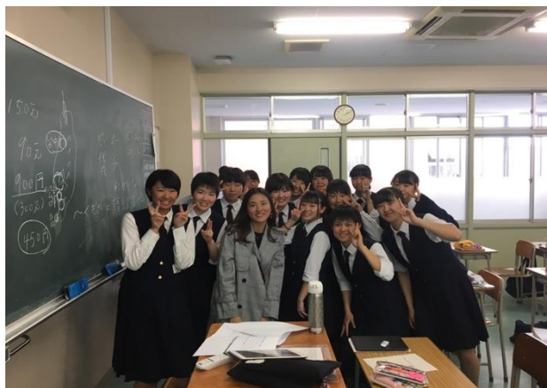
* 下課時間和女高中生們合影

表完了，第一次參加這種活動，高中生也比我想像的有反應，雖然開始前有些緊張，不過真的是個很好的經驗。