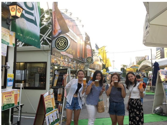
* 和 TA 們去參加德國啤酒節