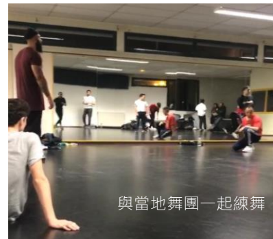
與當地舞團一起練舞

我很幸運的在那裡找到一個舞團，每周一、二、五，都會在離我步行十分鐘距離的一個青年活動中心的舞蹈教室裡面練舞，並開放給所有人。我當然沒有放過這個機會，也因此認識到很多當地的舞者！