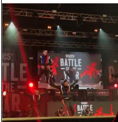
參加他們比賽的畫面→