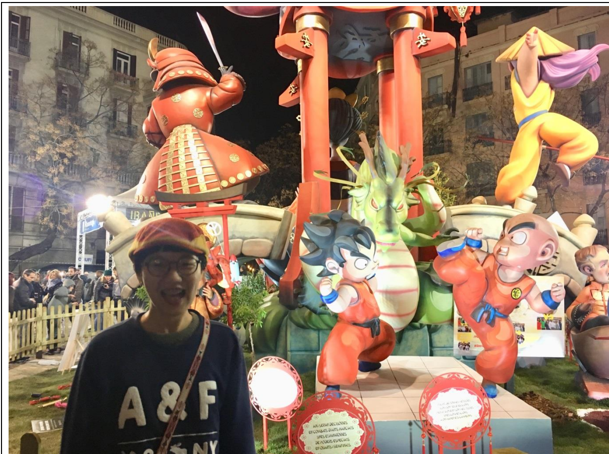
到Valencia參加Las Fallas 火節。