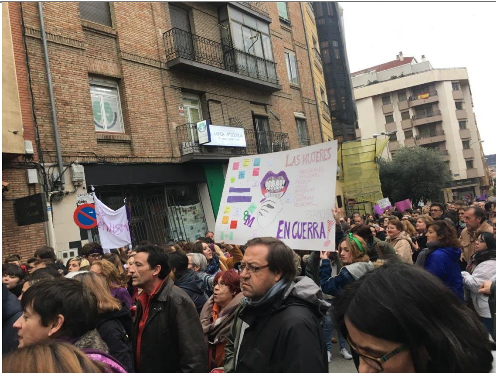
三月八日婦女節女權遊行。