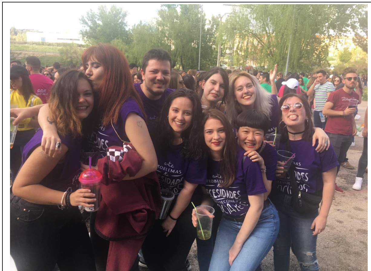
校園期末派對, El Campus。