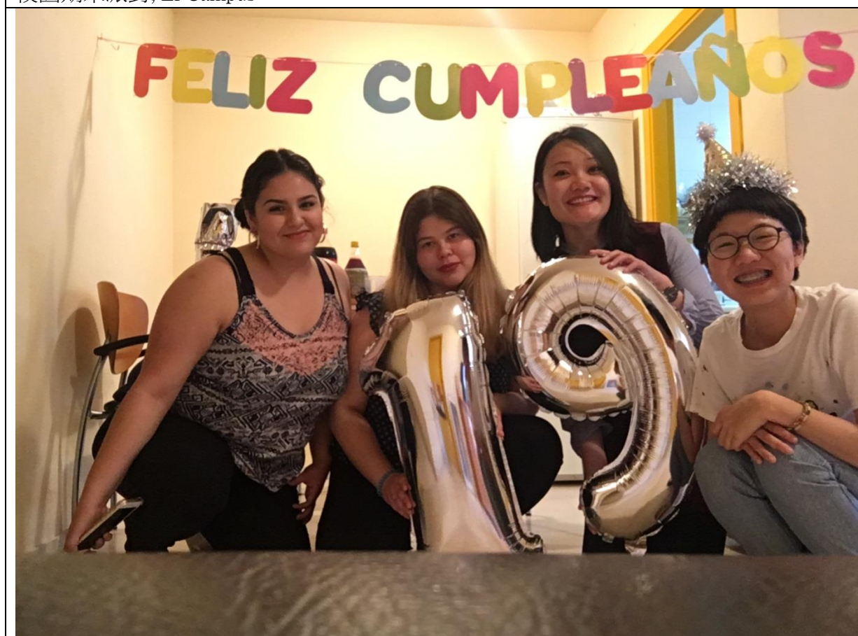
室友幫我慶祝19歲生日。