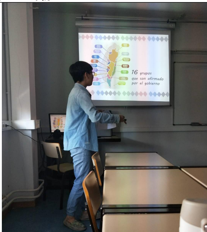
藝術史專題報告：原住民藝術。