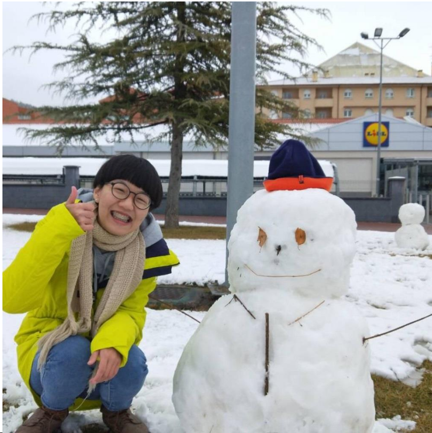
人生中的第一個雪人。