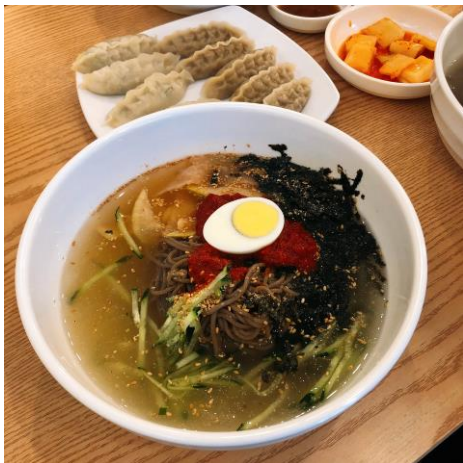
▲冷麵 6000 韓元(約台幣 160 元)

在飲食方面，韓國的物價比台灣高出一些，平均每一餐是在 5000 韓元左右(約台幣 135 元)，當然也有簡單的飯捲 2000 韓幣(約台幣 55 元)，想要方便又省錢了話，韓國便利商店有很多優惠活動，像是 1+1、2+1 等等優惠活動，例如牛奶買 2 送 1、餅乾買 1 送 1 等等，都可以省下不少的錢。