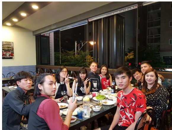
▲大家各自回國前聚餐