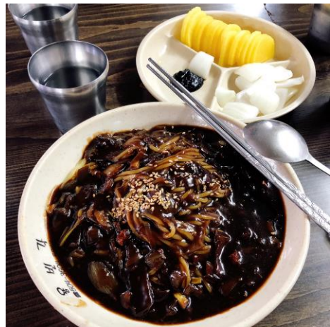
▲炸醬麵 4500 韓元(約台幣 120 元)

在到韓國前，國際交流中心的老師有寄了 Buddy Program 的申請書給我，可以自己考慮是否需要申請，我認為申請 Buddy 能夠更快熟悉東西大學以及韓國生活，於是我向學校提出了申請。最後到韓國也確定申請到了一位 Buddy，她是一位正在學習中文的學姊。參加這個計畫有規定一學期需至少與自己的 Buddy 見面 8 次以上，我們會一起出去釜山逛逛、吃飯、去咖啡廳聊天，我們都用中文及韓文對話，參加這項計畫不僅能夠認識新的朋友，也能有文化上及語言的交流，幫助彼此學習。學校也經常舉辦很多活動，幫助大家更了解韓國，像是這學期我參加了校外郊遊，學校將我們分為小組，每小組有三位韓國學生及三位外籍生，以小組進行活動、參訪釜山景點。還有韓國文化體驗，我們穿了韓服、唱韓國傳統歌謠以及品嚐韓國傳統糕點。在學期末前還有一個活動叫「International Day」，這個活動主要是有許多不同的國家會有攤販展出，有當地傳統的美食、文化的介紹以及精彩的表演，幫助大家認識不同國家以及提供文化交流的機會。