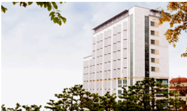
▲International House 2 宿舍

接駁車到達學校後，有宿舍的學生管理員迎接你，帶領你到你的宿舍。住宿的部分有兩棟宿舍分別為 International House 2 及 Global Village ，這兩棟的住宿生都是外籍生，皆為兩人一室一衛浴，且兩棟宿舍都是位於校園內，上下課很方便。這次我被分配到的宿舍是 International House 2 ，一學期的費用為 53 萬韓幣(約台幣 1 萬 5 千元)，大門出入使用的是指紋密碼鎖，水電及網路皆不須額外費用，宿舍一樓有提供交誼廳、共用廚房及頭幣式洗衣、烘衣機給住宿生使用，宿舍四樓外有銀行及 A T M 可以使用。在抵達韓國前，因為基於衛生問題，學校不提供寢具的部分，所以國際交流中心的老師會在你出發前詢問是否需要幫你訂購寢具，一套為 3 萬韓元(約台幣 800 元)，如果選擇不統一訂購，也可以自己從台灣帶到韓國或是在當地自行購買。因為考慮到韓國冬天天氣較為寒冷，擔心學校統一訂購的寢具較不保暖，我是自己帶毛毯到韓國，枕頭及床單的部分則是在當地進行購買。