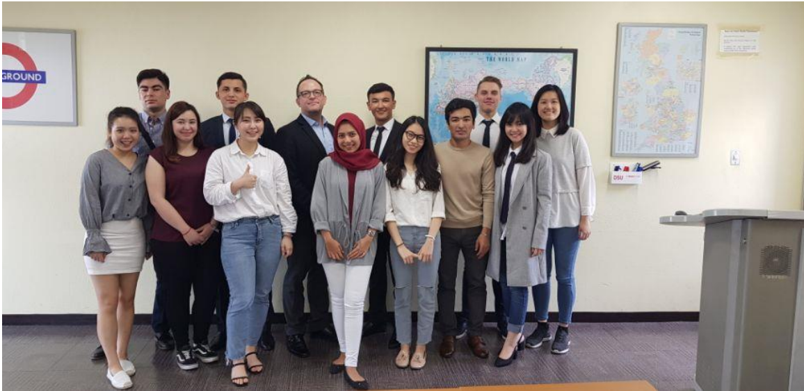
▲Marketing Across Borders 課程教授及同學合照

我所選修的課程除了 TOPIK 韓檢課程為韓文授課外，其餘課程皆為英文授課，英文授課的教授也皆為外師，多數課程使用投影片進行，也會進行個人口頭報告及團體報告。除了期中與期末考試成績外，平時出席率、作業及平時考也會納入總成績考量。