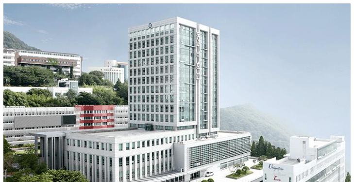
▲東西大學主校區 ▼東西大學海雲台 Centum 校區