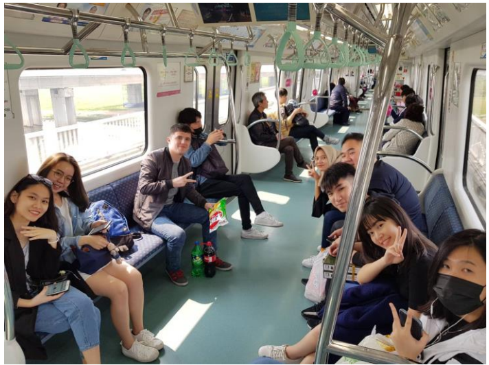
▼韓國釜山地鐵車廂

在飲食方面，韓國的物價比台灣高出一些，平均每一餐是在 5000 韓元左右(約台幣 135 元)，當然也有簡單的飯捲 2000 韓幣(約台幣 55 元)，想要方便又省錢了話，韓國便利商店有很多優惠活動，像是 1+1、2+1 等等優惠活動，例如牛奶買 2 送 1、餅乾買 1 送 1 等等，都可以省下不少的錢。