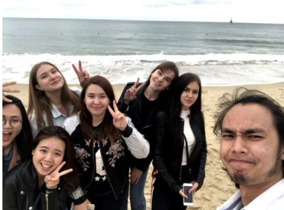
▲大家一起去看日出