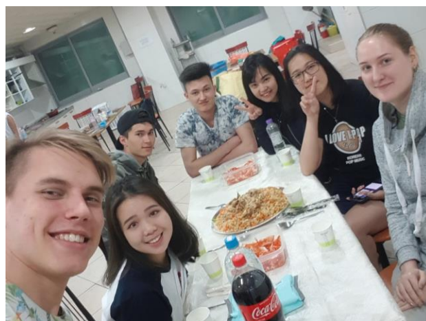
▲烏茲別克同學準備傳統美食