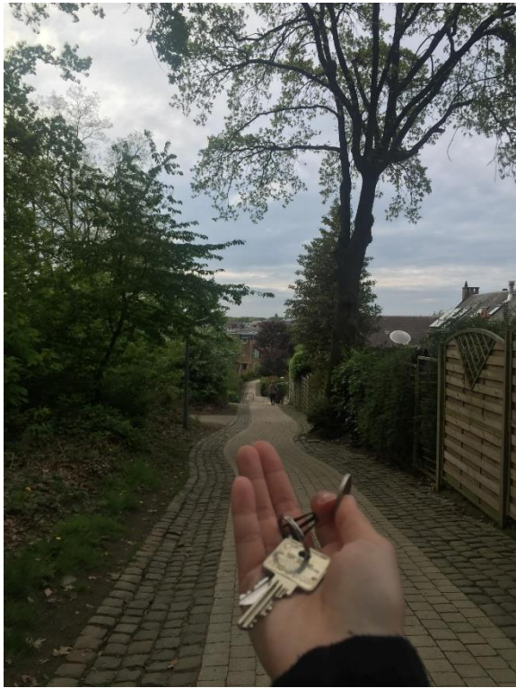
找到失而復得的鑰匙，不然就得賠款 300 歐元