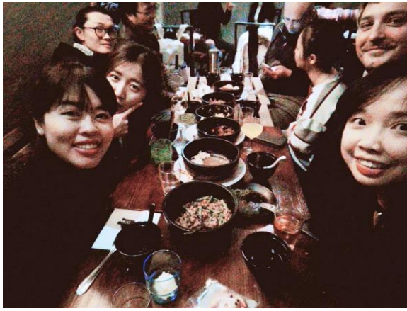
與朋友在布魯塞爾中餐館__大方閣吃年夜飯