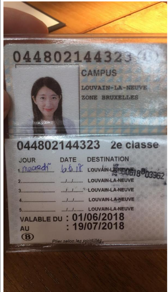
找到了失而復得的交通卡，這事 campus 交通卡的長相