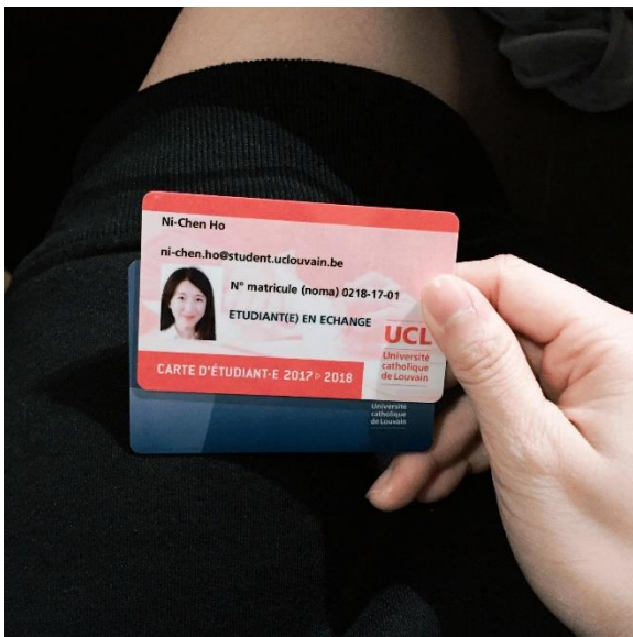
若想在學校運動中心運動，可以去中心申請，半年 30 歐元 圖書館與學生證分別是兩張卡 期末考需要帶學生證應考