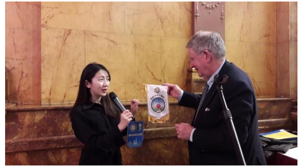
代表高雄 XX 社拜訪布魯塞爾的主席