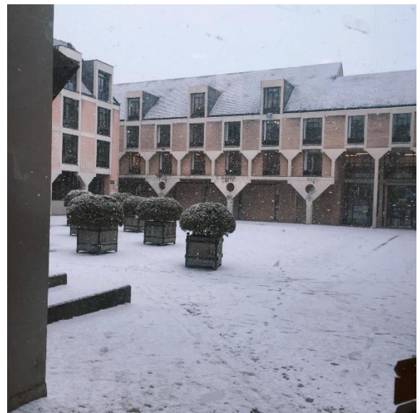
三月仍舊下雪的新魯汶